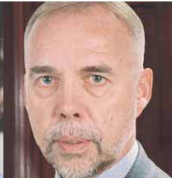
Olav Stokkmo / Secretario general de la Federación de Entidades de Gestión de Derechos de Reproducción (IFRRO)

«Acceso a la propiedad intelectual» es una expresión clave en relación con el conocimiento, la educación y la cultura. Las entidades de derechos de reproducción (RROs) son la alternativa para ofrecer acceso legal cuando la gestión individual es impracticable, aumentan la concienciación sobre el derecho de autor y luchan contra la piratería, fenómeno muy presente en el continente latinoamericano. Las RROs miembros de IFRRO, que conforman una red global, recaudaron y distribuyeron entre autores y editores más de 500 millones de euros en el 2005. En Latinoamérica las RROs pueden desempeñar un papel importante. Hacen falta formas de acceso sencillas a las obras y la piratería no se combate con éxito sin una RRO. El comité de IFRRO para América Latina ha apoyado a los titulares latinoamericanos a establecer RROs, y este trabajo ha dado resultados. Hace 10 años, la única RRO del continente era ABDR, en Brasil, y hoy existen ya 9 (6 de ellas en IFRRO), aunque no todas funcionan plenamente. Con la participación de los autores y editores, IFRRO seguirá contribuyendo al respeto del derecho de autor en América Latina.