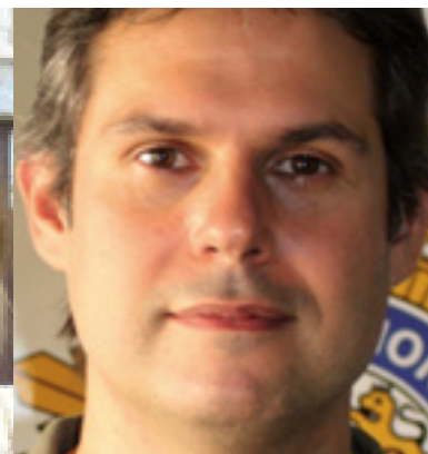
Inspector Jefe del Grupo de Delitos contra la Propiedad Intelectual (*)

Dentro de las misiones del Cuerpo Nacional de Policía se encuentra la persecución de las actividades ilícitas tipificadas en el Código penal con el epígrafe «de los delitos relativos a la Propiedad Intelectual e Industrial, al mercado y a los consumidores». La actividad policial en la «lucha contra la piratería» en España está a cargo de unidades de la Comisaría General de Policía Judicial, y localmente en los Grupos de las distintas Jefaturas Superiores, comisarías provinciales y locales. El desarrollo de las nuevas tecnologías ocasiona un abaratamiento de los costes y una gran facilidad para la reproducción, plagio y distribución de las obras literarias, artísticas y científicas, lo que origina la aparición de organizaciones delictivas dedicadas expresamente a esta actividad ilegal por los grandes beneficios que reporta. El Cuerpo Nacional de Policía está realizando un gran esfuerzo para erradicar esta delincuencia, contando con la colaboración de entidades como CEDRO. Todo ello con la finalidad de proteger no solo los legítimos derechos patrimoniales de los autores de las obras, sino también de uno de los bienes más importantes de cualquier sociedad, el desarrollo de la cultura.